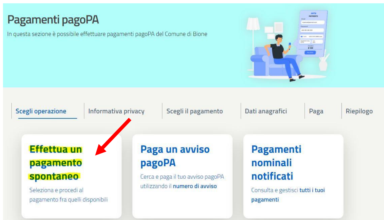
Fig. 2 Portale Municipium: effettua un pagamento spontaneo

2. Quindi selezionare la voce EFFETTUA UN PAGAMENTO SPONTANEO (fig.2)